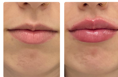
Aumento de labios