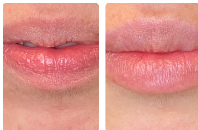
Corrección de asimetrías